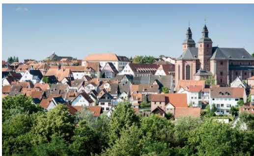
Stadtansicht von der Heide aus mit der herausragenden Wallfahrtsbasilika St. Georg

Die größte eucharistische Wallfahrtsstätte Deutschlands mit jährlich weit über 80.000 Pilgern freut sich auf Ihren Besuch. Mit der Wallfahrtsbasilika „Zum Heiligen Blut“, sechs „lebendigen“ Museen, Römerausgrabungen und vielem mehr wird Walldürn auch für Sie zum Erlebnis.