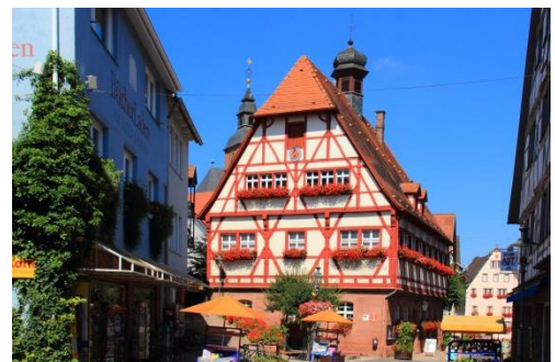
Das historische Rathaus der Stadt Walldürn – ein prächtiges Fachwerkhaus aus dem Jahre 1448

Mehr zur Wallfahrtsstadt Walldürn erfahren Sie auf unserer Homepage .