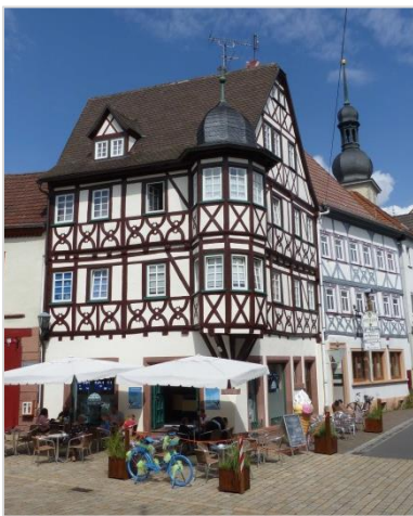
Fachwerkhäuser in der Altstadt von Lauda

Die Weinstadt Lauda-Königshofen im Lieblichen Taubertal an der Romantischen Straße bietet mit ihren zwölf Stadtteilen für jeden Geschmack genau das Richtige. Herrliche Weinberge, die idyllische Tauberaue und naturbelassene Wälder prägen das Landschaftsbild der Stadt.