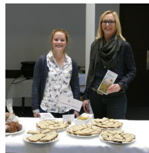
Fränkischer Grünkern-Aufstrich beim Markt der regionalen Produkte

Die Veranstaltung im Harz brachte zwei interessante und lehrreiche Tage. Wir freuen uns im nächsten Jahr wieder daran teilnehmen zu dürfen.